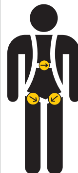
Gráfico de ubicación y sentido de ajuste de las hebillas.

HEBILLA REGULABLE.- Los arneses HAUk están provistos de hebillas regulables pasantes que permiten una rápida y exacta regulación de acuerdo con la talla del operario, con lo que otorga comodidad al trabajador.