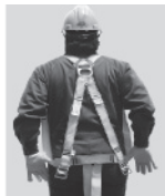
3. Colóquese el arnés como si fuera un chaleco; la anilla "D" debe quedar en la espalda y al centro de los hombros.