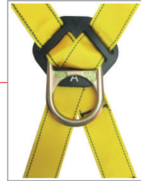
Vista Posterior Anilla Dorsal