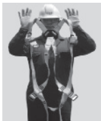
2. Sostenga el arnés de las correas de los hombros.