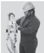
1. Tómelo de la anilla "D" que se encuentra entre las etiquetas de marca y las instrucciones