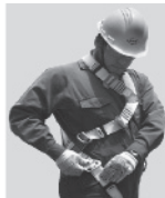
3. Abroche las hebillas que cuelgan a la altura de las piernas y proceda a regular.