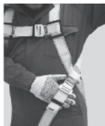
3. Regule todas las hebillas de tal forma que quepa una mano apretada entre la ropa y las correas.