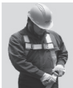
2. Abroche las correas que cuelgan a la altura de las piernas.