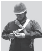
2. Abroche la hebilla que está a la altura de la cadera.