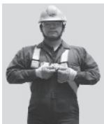
1. Abroche la hebilla que queda a la altura del pecho.