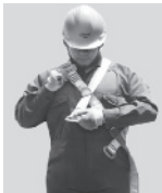
1. Abroche la hebilla que queda a la altura del pecho.