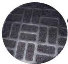
Vista interior de base reforzada de plástico