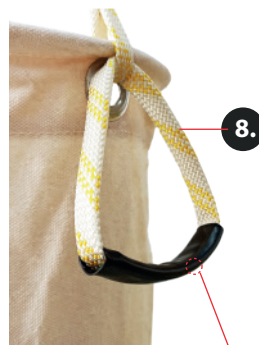
Manga de refuerzo